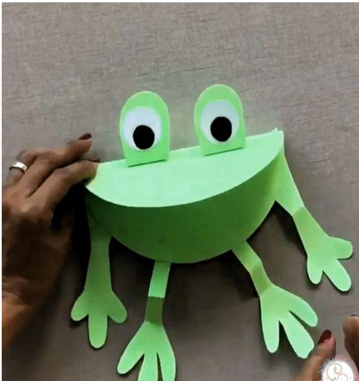
VV: Žabka z papíru